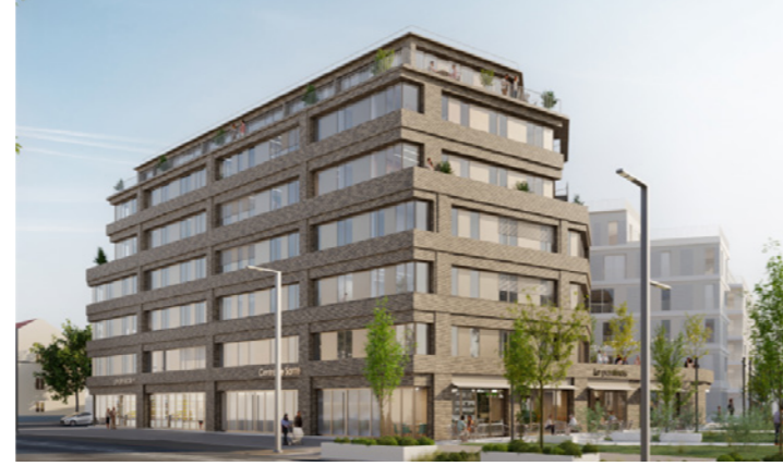
Les Pantinoises, Lot 1 ③