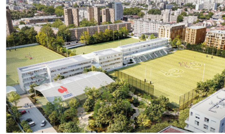
Le Centre d'innovation des rugbys ⑦

et une grande pharmacie en rez-de-chaussée. Nous cherchons également à attirer un cabinet de radiologie (③).