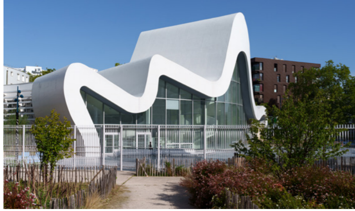
Le Centre culturel Nelson Mandela ①